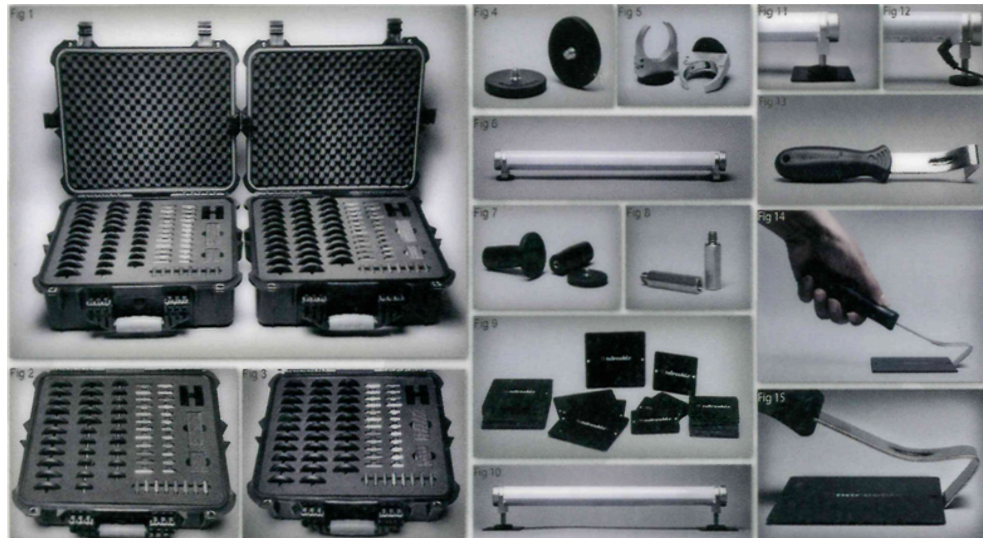
Tabelle 1: Androokie Spezifikationen Magnet